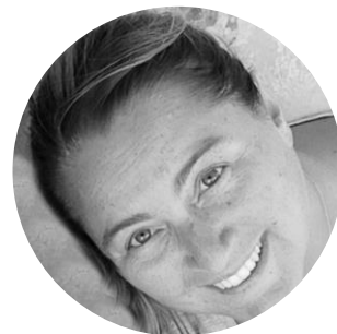
VALENTINA ROGNOLI DESIGN