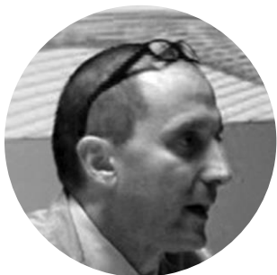
ANDREA RATTI DESIGN